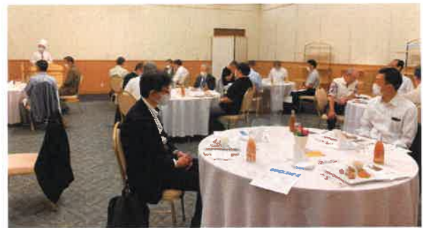
マスク会食で、和やかに