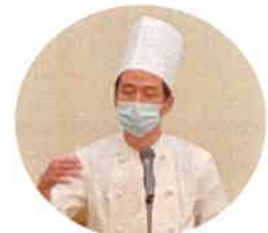
シェフのあいさつ