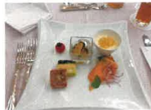
美味しいお料理と デザート