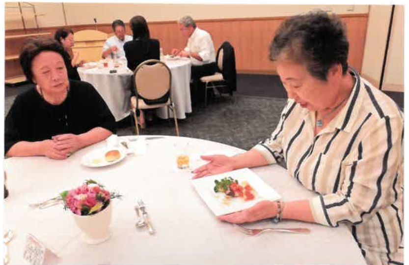
とても美味しい本日のイタリアンお料理 皆さん完食 90分アット云間に！