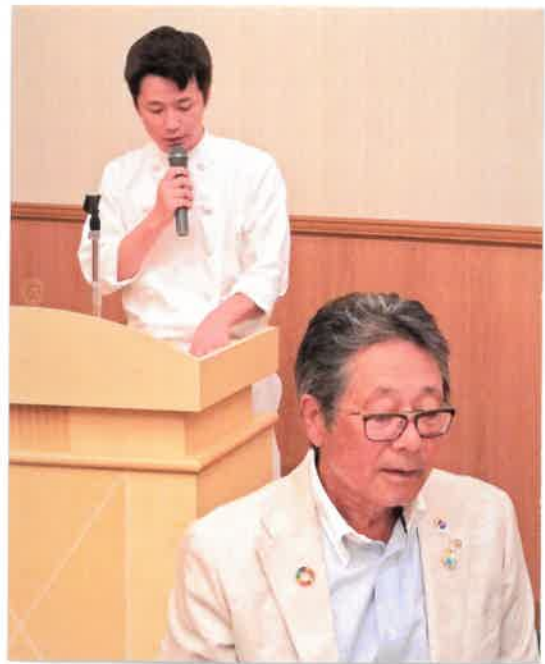
シェフより本日イタリアンお料理説明が