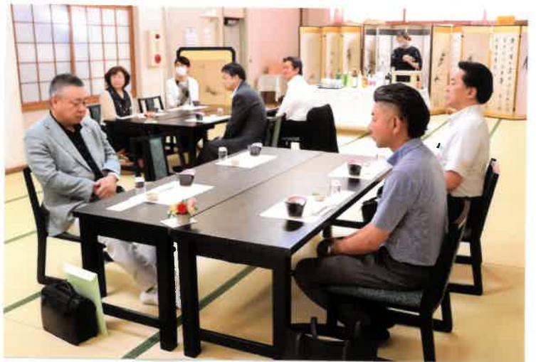
活力 100% 力漲る 16 名の皆様で