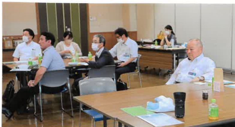
熱心に拝聴される会員の皆さん