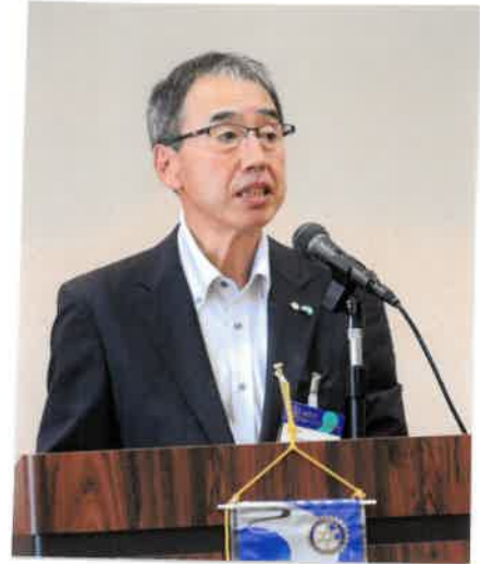
○小田島クラブ奉仕委員長さん 職業/社会/国際奉仕委員会 事業取組も報告