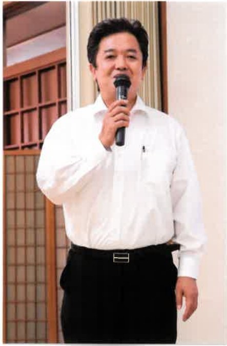
穂苅親睦委員長 司会進行