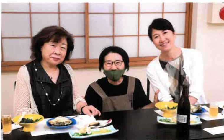
「膳処くろひめ」女将さん (樋口会長奥様のサービスを受けて)