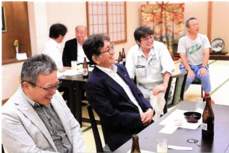
皆さん意気投合 楽しい一時でした！