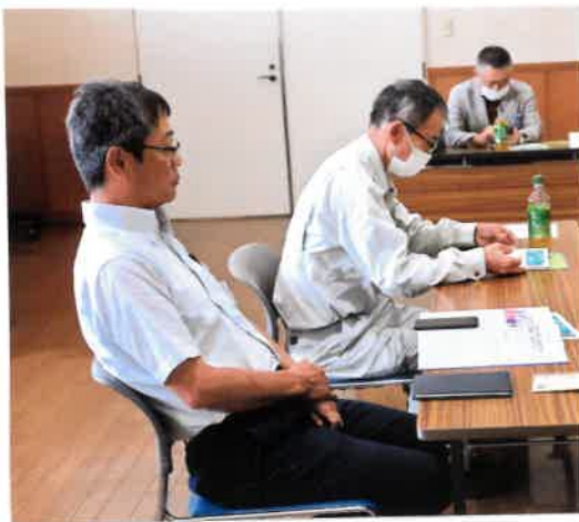
出席 100% 会員さん記念品贈呈