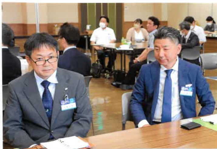
後ほど紹介される新入会員の二人様 やや緊張気味の様子！