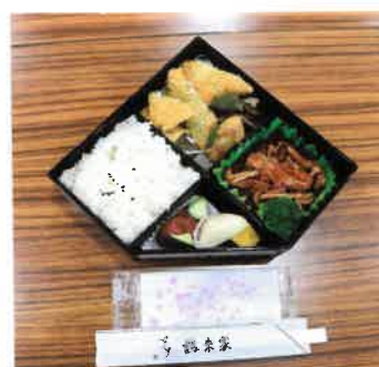
本日のお弁当は鶴来家さん 美味しく頂きました！